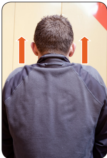
1. Løft skuldrene.