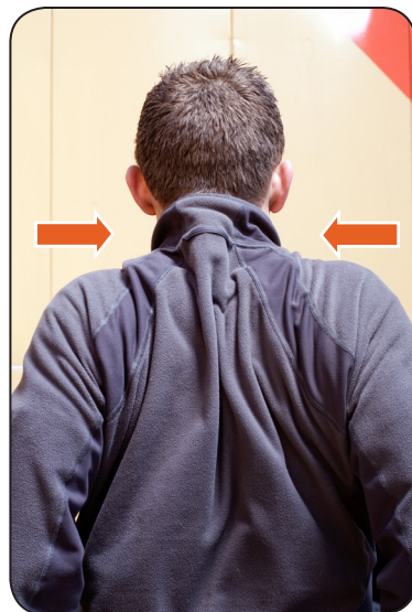
2. Saml skulderbladene, mens skuldrene er løftede.