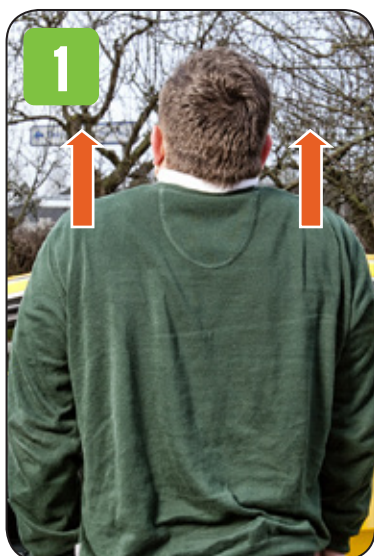
1. Løft skuldrene.