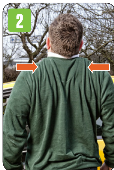
2. Saml skulderbladene, mens skuldrene er løftede.